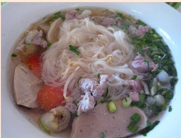
こめ こめん めん 米粉麺のスープ麺