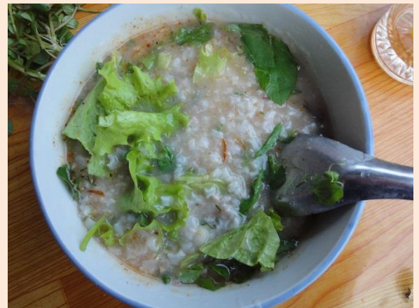
にほん かゆ もの 日本のお粥のような物