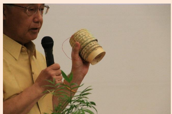
これは何?(答えは、蒸したご飯を入れる、日本 の弁当箱のような入れ物)