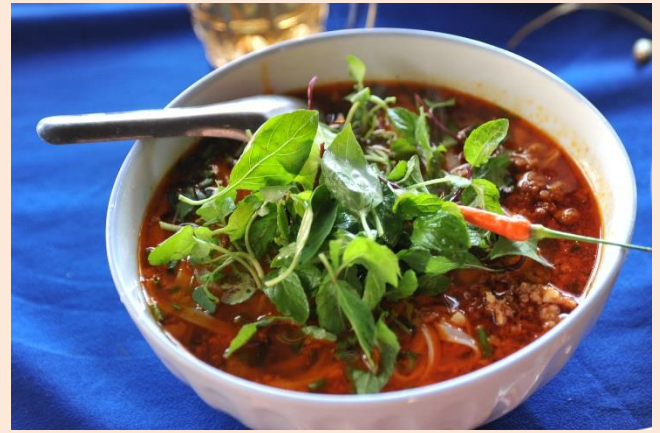
しゆしよく こめ こめ こめん や ラオスの主食は米・米粉麺。これはハーブや野 さい い めん 菜を入れたスープ麺