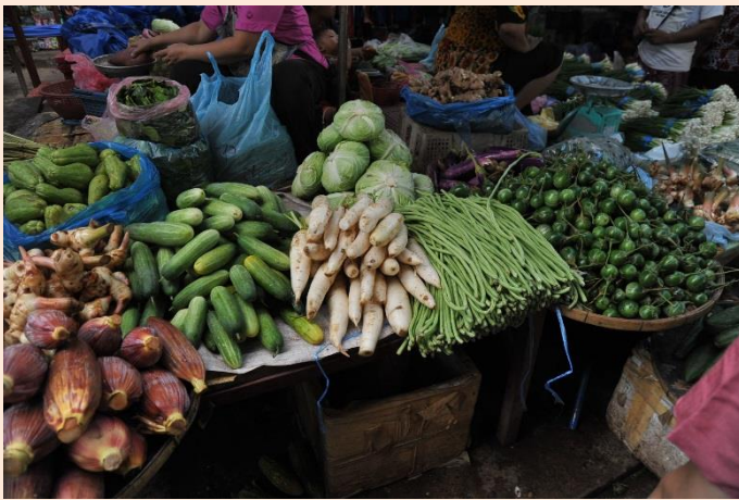
いちば う ほうふ やさい 市場で売られている豊富な野菜