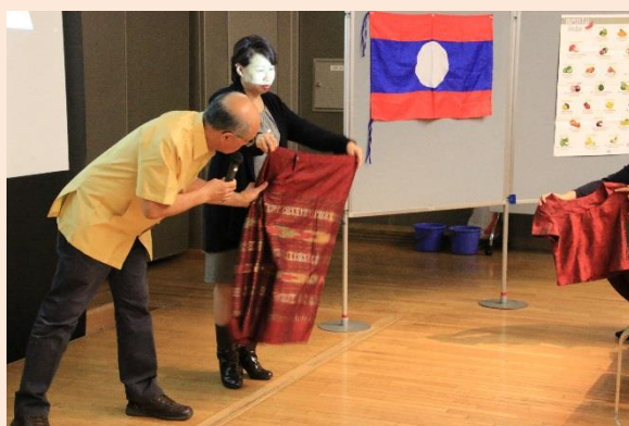
だんせいようじょせいようみんぞくいしやうしやうかい 男性用・女性用民族衣装を紹介