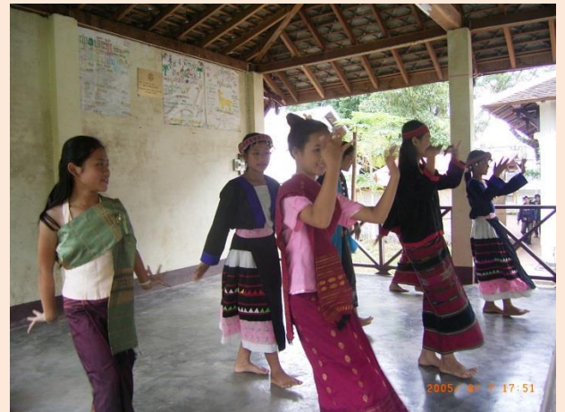
こ けいしやう みんぞくぶよう 子どもたちにも継承される民族舞踊