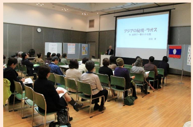
あめかかわおおかたさんかねっしんちようこう 雨にも拘らず多くの方が参加し、熱心に聴講