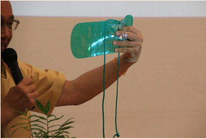
みずまつ けいたいでんわ い ぼうすいぶくろ これは水祭りのときに携帯電話などを入れる防水袋