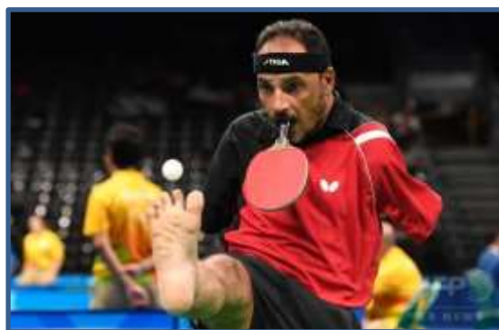
リオパラリンピックの写真を紹介