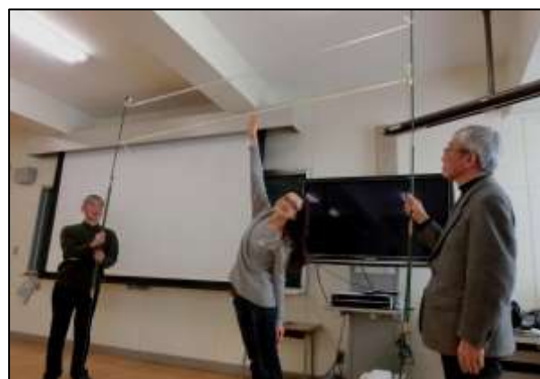
走り高跳びの世界記録(男子と女子) 「こ〜んなに高いんです!」